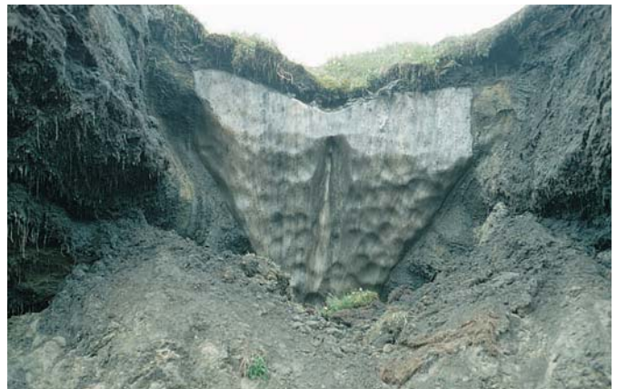
Abb. 2: Eiskeil im Permafrostboden in der sibirischen Arktis.

Seit den späten 1960er Jahren werden an vielen Stellen in der Arktis, aber auch in Hochgebirgen, Veränderungen des Permafrosts durch Erwärmung beobachtet; Neubildung von Permafrost ist dagegen nur minimal. Eine anfängliche Erwärmung der Permafrostoberfläche führt dazu, dass die untere Grenze der Auftauschicht zunächst weiter nach unten wandert. Erst wenn die Erwärmung anhält, wird sie sich bis in tiefere Permafrostschichten auswirken.