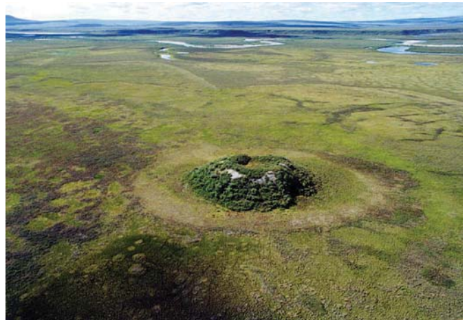
Abb. 1: Im kontinuierlichen Permafrostboden bilden sich Pingos, wenn das Wasser austrocknender Seen gefriert und dabei feines Sediment nach oben gedrückt wird.

Der Prozess des Auftauens erfasst in den Sommermonaten die Oberfläche der Permafrostgebiete und erreicht je nach Klimabedingungen und Bodenbeschaffenheit eine Tiefe von 50 cm bis einige Meter. Die Dicke der Auftauschicht hängt dabei stark von der Lufttemperatur, der Schneebedeckung und der Vegetation ab. An der Oberfläche entsteht ein Wasserstau, da das Schmelzwasser wegen des gefrorenen Unterbodens nicht versickern kann. Der entstehende Auftauboden ist daher besonders stark wasserdurchtränkt und sehr beweglich. Schon bei geringer Hangneigung kommt es zum Bodenfließen (Solifluktion).