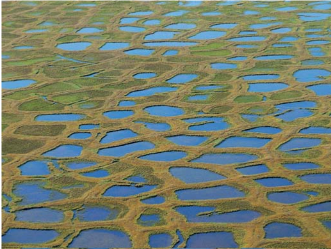
Abb. 3: Tundra mit Eiskeil-Polygonen im Lena-Delta, sibirische Arktis (Foto: K. Piel). Datei: Polygone-Piel.jpg

Eine nicht zu unterschätzende Konsequenz durch tauenden Permafrost ist die Emission von Gasen, die aus mikrobiologischen Prozessen stammen, also vor allem Kohlendioxid und Methan. Durch tauenden Permafrost können sich die Vegetationszonen (z.B. die Baumgrenze) weiter nach Norden verschieben und damit das gesamte arktische Ökosystem verändern. Großflächig sind die Beobachtungen von tauendem Permafrost eher indirekt und orientieren sich an Veränderungen der Vegetation von Tundra und Wäldern, an der Absenkung des Bodens, dem Vernässen einer Landschaft oder auch dem Verschwinden von Seen (siehe Folge 19 – Studenten am Polarkreis).