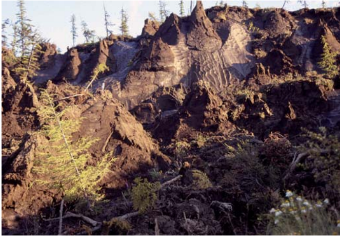
Abb. 9: Eisreicher Permafrost am Standort Duvanny Yar am östlichen Ufer der Kolyma. Die Permafrostabfolgen werden als Umweltarchiv betrachtet, da in ihnen zahlreiche fossile Reste der Pflanzen- und Tierwelt eingefroren sind.

Die dabei untersuchten Permafrostabfolgen enthielten sowohl Spuren warmzeitlicher Permafrostdegradation (z.B. eemzeitliche sowie holozäne Eiskeilpseudomorphosen, Seesedimente und Torfablagerungen) als auch eisreiche Schichten mit großen Eiskeilen, die während der Saale- und der Weichsel-Kaltzeit gebildet wurden. Umfangreiches Probenmaterial wird derzeit analysiert, um das Bild der Permafrostdynamik in der sibirischen Arktis während Klimaschwankungen in der Vergangenheit zu erhalten. Erste Ergebnisse zeigen die Entwicklung von Thermokarstsenken in Abhängigkeit von spätquartären Klimaschwankungen.