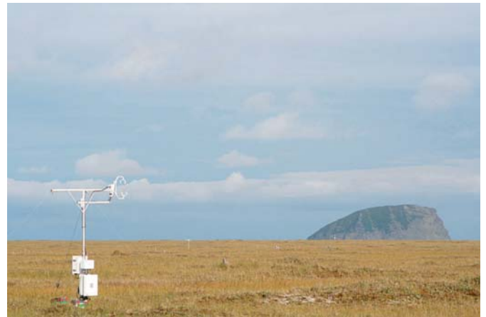
Abb. 4: Messfeld an der Samoylov-Station im Lena-Delta, Sibirien im August 2008.

• Langzeitmessungen auf Samoylov im Lena-Delta: Um besser verstehen zu können, warum Permafrost an manchen Stellen taut, wie beispielsweise auf Spitzbergen, und an anderen nicht, werden vor allem die Transportprozesse von Wärme und Wasser in verschiedenen arktischen Ökosystemen untersucht. Darauf aufbauend soll ein prozessgesteuertes Modell für die in der Arktis vorherrschenden Permafrostsysteme entwickelt werden, um die Abläufe im Untergrund besser vorhersagen zu können. Neben Samoylov (Abb. 4) fanden Untersuchungen auf Spitzbergen (Ny Alesund) und in der hohen kanadischen Arktis am Polar Bear Pass statt.