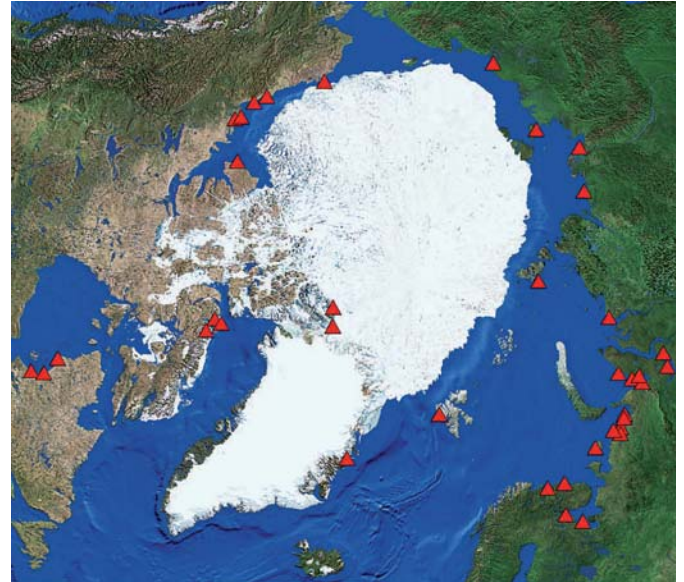
Abb. 7: Satelliten-Karte der Arktis mit den 41 Stationen, die zum Arctic Circumpolar Coastal Observatory Network (ACCOnet) gehören (Karte: H. Lantuit, 2008).

begonnen (Abb. 7). Es sollen Veränderungen der arktischen Küste quantifiziert werden, um daraus digitale Geländemodelle zu errechnen und die Einträge an Sediment, Kohlenstoff und Schadstoffen in die arktischen Küstenmeere und den Ozean abschätzen zu können (Abb. 8). Dieses Vorhaben wird von der Europäischen Raumfahrtbehörde ESA durch die Bereitstellung von 350 detaillierten Satellitenbildern ausgewählter Küstenbereiche des Arktischen Ozeans unterstützt.