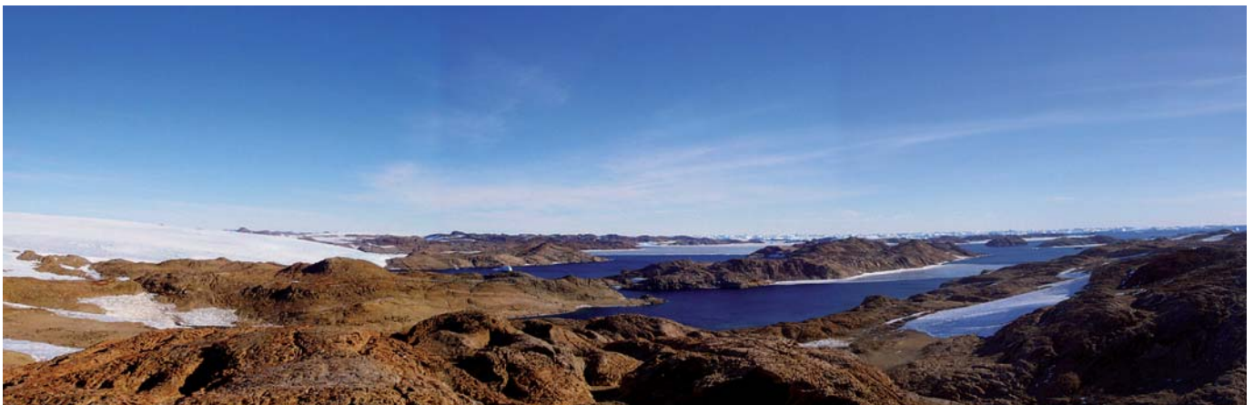
Abb. 10: Blick vom Feldlager über die küstennahen eisfreien Gebiete der Larsemann-Berge, Prydz-Bucht, Ostantarktis.