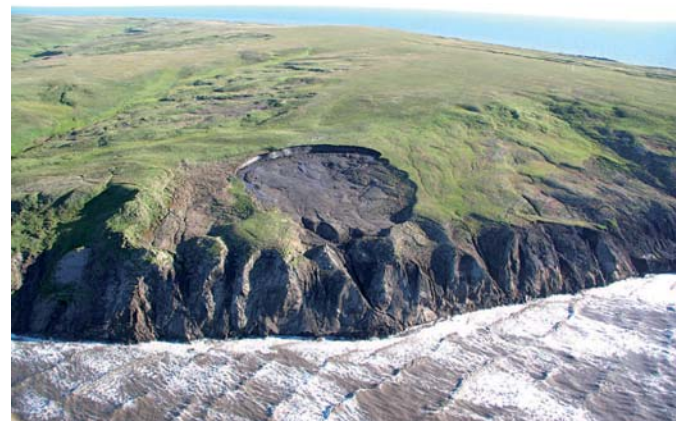
Abb. 8: Rückschreitende Erosion an der Yukon-Küste, Herschel-Insel, Beaufortsee, Kanada, die durch auftauenden Permafrost verursacht wird. Durch diese Rutschmassen gelangen episodisch Sediment und Kohlenstoff in das Schelfmeer. Das Küstenkliff im Bild bestehen fast völlig aus Eis und sind mehr als 20 m hoch.