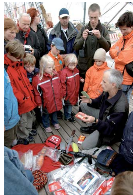
Wissenschaftler demonstrieren den Inhalt einer Notfallkiste, die bei Polarexpeditionen eingesetzt wird