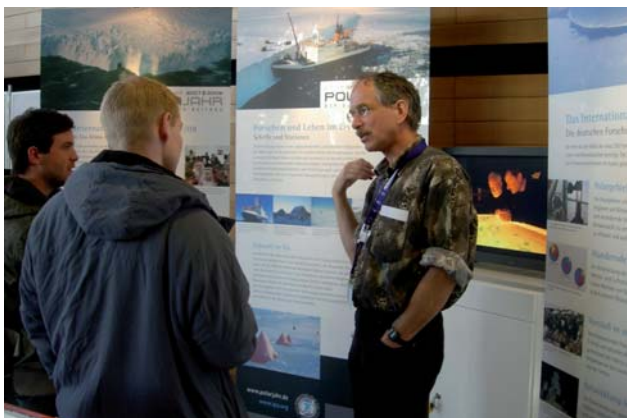
Wissenschaftler im Gespräch mit Besuchern des Extrem-Wetter-Kongresses am 23. März 2007 in Hamburg