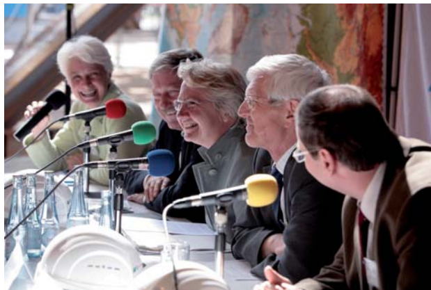
Pressekonferenz mit Forschungsministerin Dr. Annette Schavan anlässlich der Präsentation der neuen Antarktisstation Neumayer III

Ausstellungen zu Aktivitäten im Internationalen Polarjahr sprechen die breite Öffentlichkeit an. Die Anlässe für solche Ausstellungen sind ganz unterschiedlich und bundesweit nutzen Museen, Zoos und Volkshochschulen die Gelegenheit, auf das Internationale Polarjahr aufmerksam zu machen.