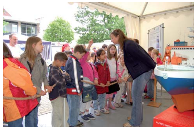
Wissenschaftler im Gespräch mit Schülern während der deutsch-französischen Wissenschaftskarawane im Sommer 2007 in Bremerhaven

Bisher nahmen sechs Lehrer an Expeditionen in die Polargebiete teil. Sie haben während der Reise via Internet mit ihren Schülern kommuniziert und im Anschluss an die Expedition Unterrichtsmaterialien entwickelt, die in Fachzeitschriften publiziert und auf Tagungen vorgestellt wurden.