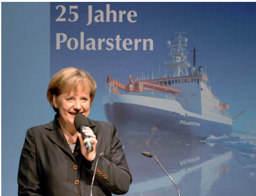
Bundeskanzlerin Dr. Angela Merkel bei der Festveranstaltung zum 25-jährigen Dienstjubiläum des Forschungsschiffes Polarstern am 28.11.2007 in Berlin